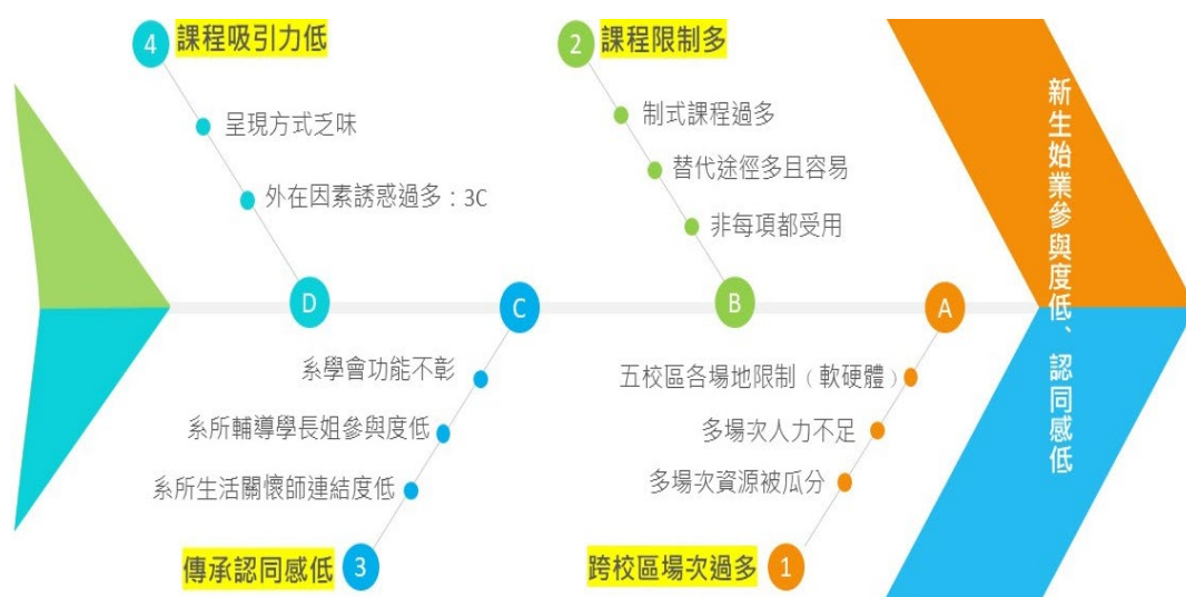
圖 2. 學生參與度低、認同感低之向右魚骨圖分析