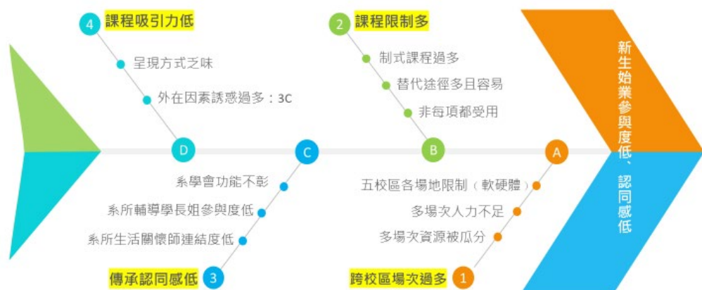
魚骨型因果關係資訊圖表 魚骨因果圖