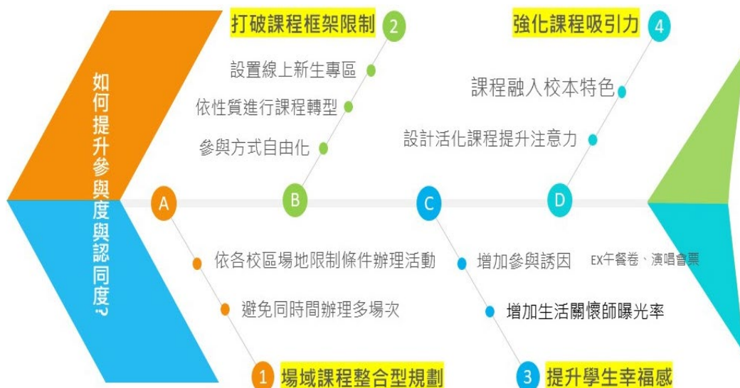
圖 3. 提升學生參與度與認同感之左向魚骨圖分析